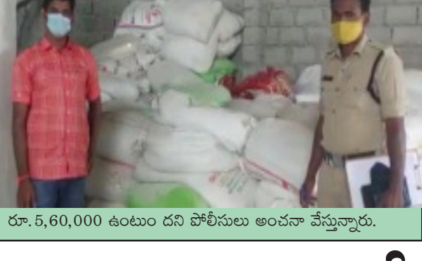
రూ. 5,60,000 ఉంటుంది దని పోలీసులు అంచనా వేస్తున్నారు.

ధర్మసాగర్, నేటికెత్తి: ధర్మసాగర్ మండలంలోని ఎలుకర్తి గ్రామంలో భారీగా రేషన్ బియ్యం పట్టుబెట్టాయి. ఎలుకర్తి గ్రామ శివారులోని ఓ పాల్లీ ఫ్యామ్ లో పీడిఎస్ రైస్ బియ్యం నిల్వ ఉన్నాయన్న సమాచారం మేరకు బుధవారం టాన్స్ ఫోర్స్ పోలీసులు దాదలను నిర్వహించగా 400 బస్తాల పీడిఎస్ రైస్ బియ్యం బ్యాగులు పట్టుబెట్టాయి. వీటి విలువ సుమారు