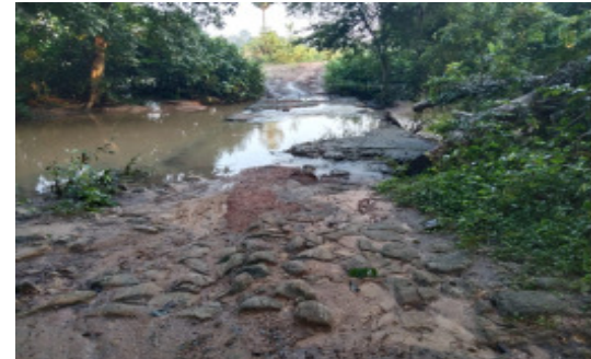
భద్రాద్రి కొత్తగూడెం గుండాల నేటి ధాత్రి: గుండాల మండలాన్ని కి 18 కిలోమీటర్ల దూరంలో ఉన్న ముత్త పురం గ్రామ పంచాయతీ లోని పెద్ద తోగూ గ్రామం వెళ్లే రోడ్డు వర్షం వడితే రోడ్డు పై కాలు పుటలేని పరిస్థితి నెల కొంది. వర్షాన్ని కి రోడ్డు అక్కడక్కడా కోతకు గురయింది. పంట చేస్తున్న రైతులు ద్వీపక వాహనంపై వెళ్లాలంటే చాలా ఇబ్బందులు కు గురవుతున్నారు. టైల్ ప్రమాదాలు జరుగుతున్నాయి. ఇక రైతులు ట్రాక్టర్లు పై పోవాలంటే పోలేని పరిస్థితి ఏర్పడింది. గతంలో

పాలించిన పాలకులు ఎవరూ పట్టణంకోకుండా నిర్లక్ష్యంగా ఉండటం తో నేడు పెద్ద తోగూ గ్రామానికి ఈ పరిస్థితి వచ్చిందని గ్రామస్థులు ఆవేదన వ్యక్తం చేశారు. గత 40 ఏండ్లుగా పెద్ద తోగూ గ్రామం పరిస్థితి ఇంత దారుణంగా ఉన్న కూడా స్థానిక ఎమ్మెల్యే కూడా పట్టణంకోకుండా మా గ్రామాన్ని అభివృద్ధి కి దూరంగా పెడుతున్నారని అక్కడ ఆదివాసిలు ఆగ్రహం వ్యక్తం చేశారు. ఎన్నికలకు గురైన వచ్చే మా గ్రామం నేడు స్తనై రోడ్డులేక ఇబ్బందులు పడుతుంటే ఏ నాయకుడు మా గ్రామంవంక చూడటం లేదని ఆగ్రహం వ్యక్తం చేస్తూ ఆందోళన వ్యక్తం చేస్తున్నారు.