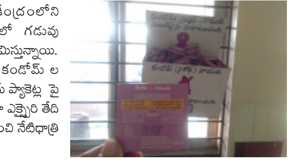
జనగామ: నేటి ధాత్రీ: జిల్లా కేంద్రంలోని ప్రభుత్వ ఏరియా దవాఖానాలో గడువు ముగిసిన నిరోధ్ పాకెట్లు దర్శనమిస్తున్నాయి. ద్వారం దగ్గర ఉన్నటువంటి కండ్లమ్మ ల పెట్టెలో ఉన్న ఆశ నిరోధ్ కండ్లమ్మ ప్యాకెట్ల పై తయారీ తేది 10/2018 ఉండగా ఎక్సైజ్ తేది 09/2021 గా ఉండడం గమనించి నేటి ధాత్రీ కెమెరా క్లిక్ మనిపించింది.