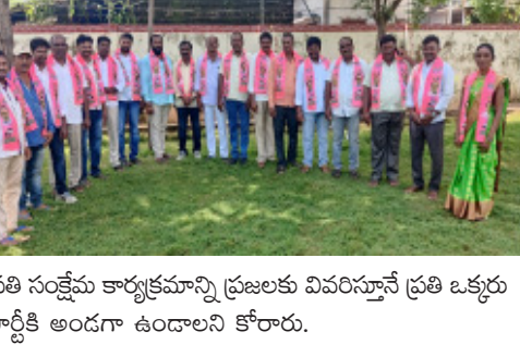
ప్రతి సంక్షేమ కార్యక్రమాన్ని ప్రజలకు వివరిస్తూనే ప్రతి ఒక్కరు పార్టీకి అందగా ఉండాలని కోరారు.