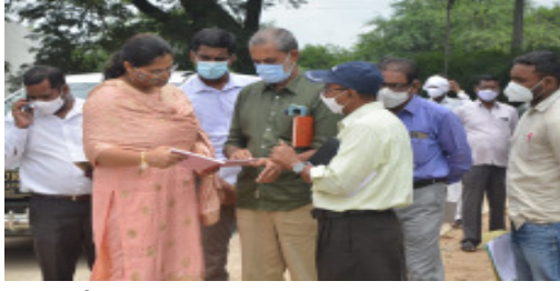
తప్పనిసరిగా పాఠశాలల్లో ప్రజా ప్రతినిధులు అధికారులకు సహకరించాలని కలెక్టర్ తెలిపారు.