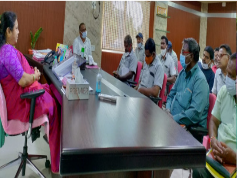
సెంటర్లో 19 పని చేస్తున్నాయని, మిగిలిన 5 కేంద్రాలను బలోపేతానికి చర్యలు తీసుకోవాలని సూచించారు.

వరంగల్, నేటిధాత్ర: మహా నగరంలోని ప్రభుత్వ పాఠశాలలన్నీ ఈ నెల 31 లోగా సోడియం హైపోక్లోరైట్ తో సానిటైజ్ చేయాలని నగర మేయర్ గుండు సుధారాణి ఆదేశించారు.