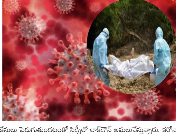
కేసులు పెరుగుతుండటంతో సిస్టీలో లాక్డౌన్ అమలుచేస్తున్నారు. కరోనా

దెస్సేనేటిపాటి: ప్రపంచ వ్యాప్తంగా కరోనా మహమ్మారి మళ్లీ మృత్యుఘంటికలు మోగిస్తోంది. వ్యాక్సిన్ షాన్ కోసం పోషకుల వైరస్ ఉద్ధృతి మాత్రం ఆగడంలేదు. గడిచిన 24గంటల వ్యవధిలో అన్ని దేశాల్లో కలిపి దాదాపు 10వేల మందికి పైగా మృత్యువాతపడగా.. 7లక్షల మందికి ఈ మహమ్మారి సోకింది. ఆమెరికా, బ్రిటన్, ఇరాన్ సహా పలు దేశాల్లో ఈ వైరస్ ఉద్ధృతి అందోకసకరంగా మారుతోంది. ఒక్క ఆమెరికాలోనే నిన్న దాదాపు 1.16 లక్షల కేసులు, 614 మరణాలు సమోదు కాగా.. ఇరాన్లో 39వేలకు పైగా కేసులు, 568 మరణాలు వెలుగుచూశాయి. ఇకపోతే, బ్రిటన్లోనూ దాదాపు 33వేల మందికి కొవిడ్ సోకింది. జులై 23 తర్వాత తొలిసారి సమోదైన అత్యధిక కేసులు ఇవేనని అక్కడి వైద్యాధికారులు పేర్కొంటున్నారు. జాన్ హాప్కిన్స్ విశ్వవిద్యాలయం వెల్లడించిన గణాంకాల ప్రకారం.. ప్రపంచవ్యాప్తంగా ఇప్పటివరకూ 20,54,62,557 మందికి వైరస్ సోకగా.. 43,35,111మంది ప్రాణాలు కోల్పోయారు. మొత్తం కేసుల్లో 18,5కోట్ల మందికి పైగా కోలుకున్నారు.మరోవైపు, దేశ వేరియంట్ విజృంభణ కారణంగానే తమ దేశంలో కొవిడ్ కేసులు పెరుగుతున్నట్లు బ్రిటన్ వైద్యాధికారులు చెబుతున్నారు. ఆ దేశంలో ప్రస్తుతం 60శాతం మంది వ్యాక్సిన్ రెండు డోసులూ తీసుకోగా.. మిగిలిన వారికి వీలైనంత త్వరగా వ్యాక్సిన్ అందించాలని వైద్యంగం నిపుణులు సూచిస్తున్నారు. మరోవైపు, ఆస్ట్రేలియాలోనూ కరోనా