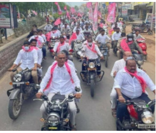
ఎక్కడ ఎన్నికలైతే, అవి సార్వత్రిక ఎన్నికలైతే, ఉప ఎన్నికలైతే, స్థానిక సంస్థల ఎన్నికలైతే సరే మంత్రి హరిష్ రావు భుజాన వేసుకున్నారంటే ఇక అక్కడ కారుకు ఎదురుండదు. ప్రత్యర్థులకు డిపాజిట్టు వుండవు. తొలిసారి ఎమ్మెల్యేలు రాజీనామా చేసిన దగ్గరనుంచి.

గజ్వెల్ లో కూడా ఆయనదే ప్రచారం హైదరాబాద్, నేటి ఢిల్లీ: ఇది సెంటిమెంటు. తెరాసలో బలంగా నమ్మే ఆసవాదాల్ని. ఒక్కసారి బ్రతుకేమీ హరిష్ రావు బరిలోకి దిగారంటే ఇక వార్ వన్ సైడే అయినట్లే.. అన్నీ విజయాల్లే.. ఇంత వరకు ఓటమి వున్నది లేదు. దుబ్బాకను బాబిగా కొందరు చూసినా, ఇది నైతికంగా హరిష్ దే గెలుపు. కాని ఆయన సాధించిన విజయాల ముందు దుబ్బాక చాలా చిన్న అంశం. తెలంగాణ ఉద్యమ జెండా ఎగరేసిన నుంచి మొదలు, ఊరూర గద్దెలు నిర్మించిన రోజులనుంచి