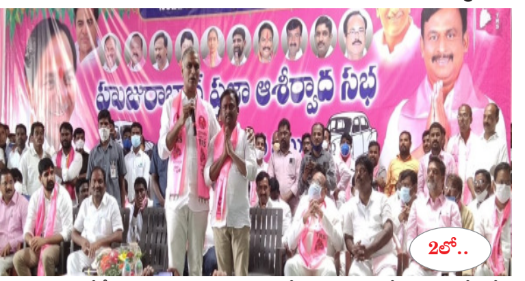
ఇల్లందకుంట (శ్రీ సీతారామచంద్రస్వామి ఆలయంలో స్వామివారికి ప్రత్యేక దర్శనం చేసుకోగా.. ఆలయ అధ్యక్షులు హర్షకుంభంతో స్వాగతం పలికారు. స్వామివారి దర్శనం అనంతరం